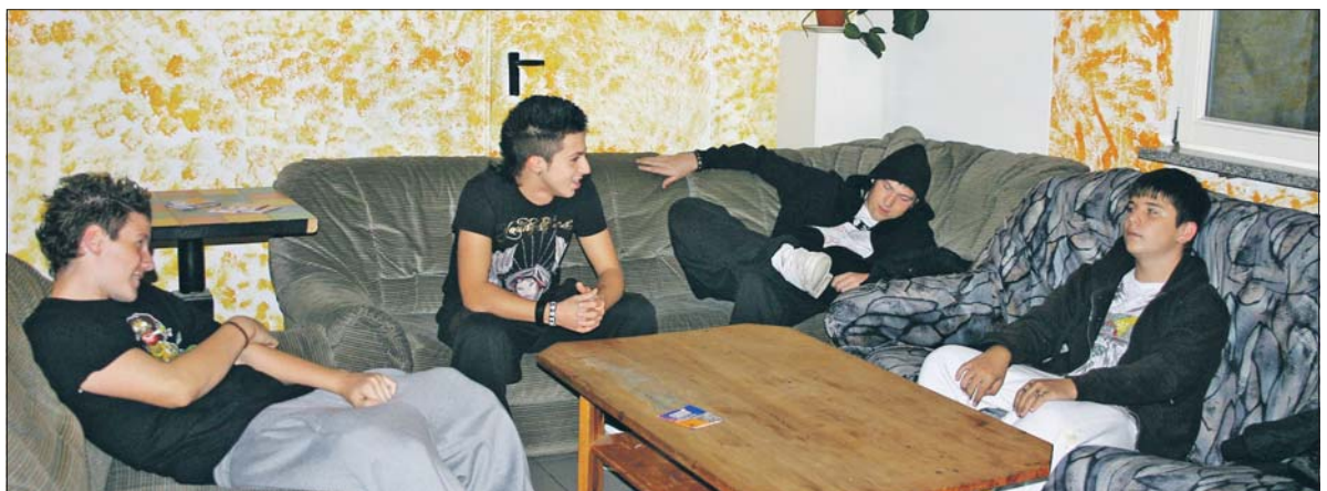
Im Bempflinger Jugendhaus lässt es sich prima chillen.

Zum Mithelfen gibt es aber immer Gelegenheit, demnach soll mal wieder gestrichen werden. Dabei dürfen die Besucher darüber entscheiden, welche Farben die Wände bekommen. Noch ist das Haus in Gelb- und Blautönen gehalten, mal schauen, was sich die neuen Innenarchitekten als Nächstes ausdenken.