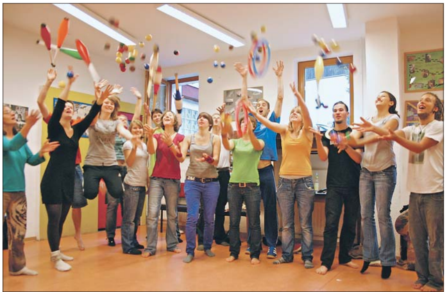
Alles fliegt beim Jonglage-Workshop des BDP in Kleinbettlingen in die Luft.

Die bekannten schwarzen Pfadfinderzelte bleiben daheim, es soll schließlich jeder